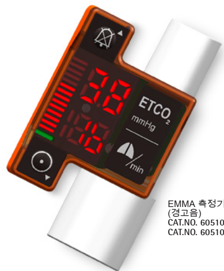
EMMA 측정기 (경고음) CAT.NO. 605100 (kPa) CAT.NO. 605102 (mmHg)