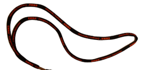
EMMA 목걸이용 줄 박스당 10개 CAT.NO. 100684