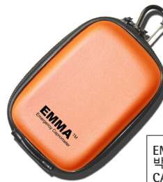
EMMA 가방 박스당 10개 CAT.NO. 100680