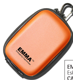
EMMA Lomme Eske med 10 CAT.NO. 100680