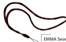
EMMA Snor Pose med 10 CAT.NO. 100684