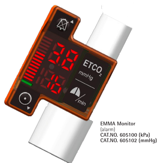
EMMA Monitor (alarm) CAT.NO. 605100 (kPa) CAT.NO. 605102 (mmHg)